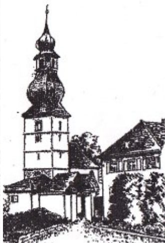
Neunkirchen a. M. Laurentiuskirche